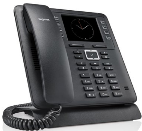
Telefono con ricevitore a filo Codice: S30853-H4003-R101