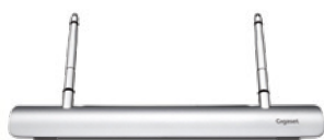
Base in metallo S30853-H4031-R101