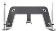
Kit de montaje en pared S30853-H4030-R101